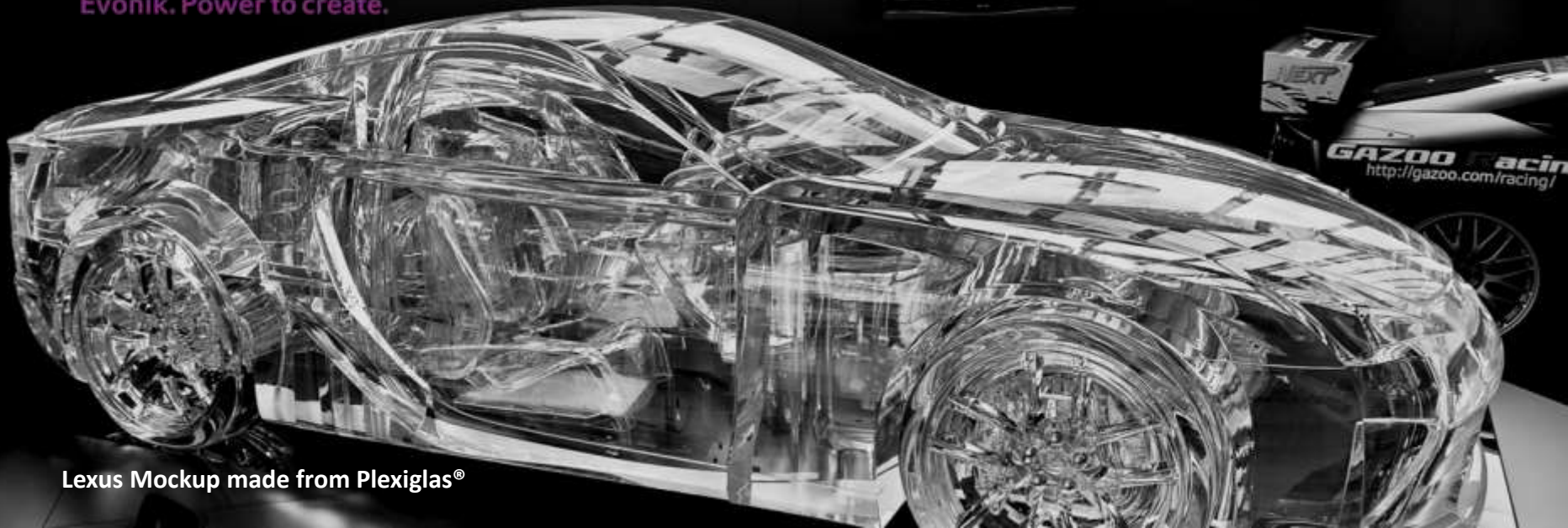
Lexus Mockup made from Plexiglas®